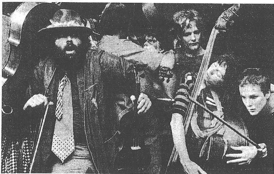
Abbildung 1: Musiker des Ersten Improvisierenden Streichorchesters in Ulm.

TV-Spielfilm mit gewissem politischem Anspruch, wo sich das Orchester aber in ein streng vorgefertigtes Drehbuch einfügen mußte; Auftritt bei der Jahrestagung der „Transpersonalen Gesellschaft“ in Konstanz; Auftritt in einer Kirche, wohin ein „Jazz-Pfarrer“ das Orchester geladen hatte; Mitwirkung in Kulturveranstaltungen zum Wahlkampf der „Grünen“. Entscheidungen, die dem Orchester durch Absagen der Veranstalter erspart blieben, waren u.a.: Auftritt bei einer Aids-Hilfe-Veranstaltung des Senders Freies Berlin; Auftritt bei der Frühjahrstagung des Instituts für Neue Musik und Musikerziehung; Auftritt im Beiprogramm der Jahrestagung 1986 des AMPF in Soest.